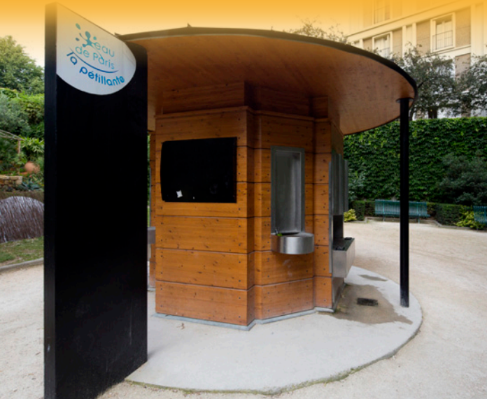
La Pétillante, Bureau d'Éclairage de Reuilly, Paris (5 e arr.), 2012