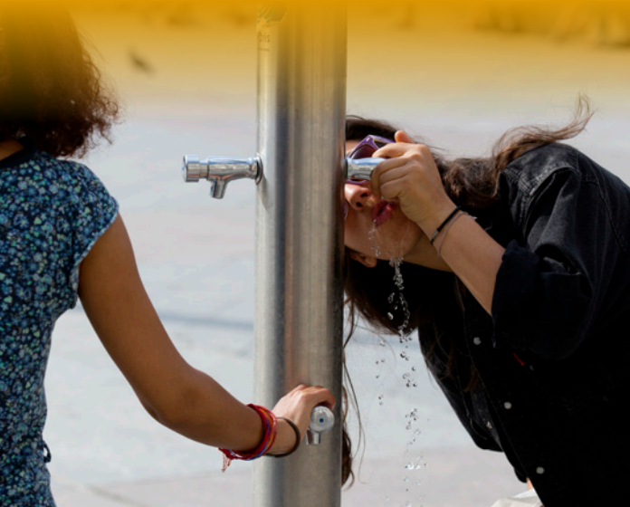
Fontaines Totem, place de l'Hôtel-de-Ville, Paris (septembre 2012)