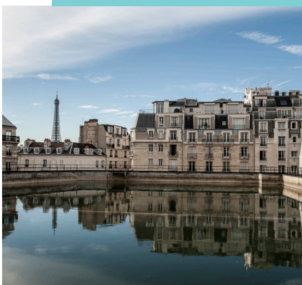
Réservoir d'eau non potable de Passy (Paris 16 e )

Pas de dégagement de chaleur sur l'espace public