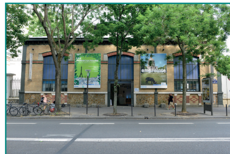
Pavillon de l'eau, Paris 16