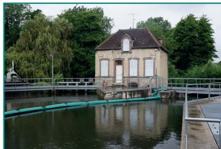
Barrage de Malay-le-Grand (89)