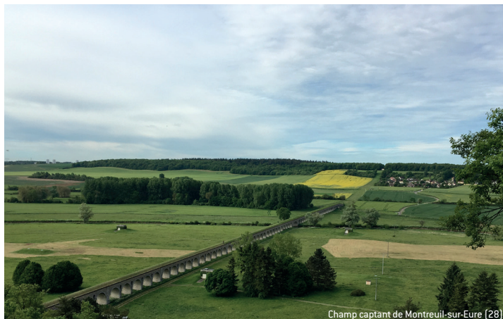
Champ captant de Montreuil-sur-Eure [28]

À l'occasion des Journées européennes du patrimoine 2017, le samedi 16 et dimanche 17 septembre, Eau de Paris vous invite à découvrir plusieurs sites dans Paris, en Ile-de-France et dans les départements de l'Eure-et-Loir et de l'Yonne. Une occasion unique d'accéder à des lieux remarquables ! Des sources de la Voulzie au Pavillon de la Porte d'Arcueil, voyagez au fil de l'eau entre infrastructures modernes et édifices historiques, grâce aux multiples visites et expositions proposées par Eau de Paris et ses partenaires.