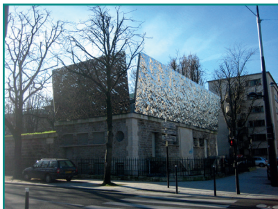
Pavillon de la Porte d'Arcueil, Paris 14

Tous les événements sont gratuits et sans inscription. Détail des visites sur le site internet d'Eau de Paris www.eaudeparis.fr - espace "Culture / Evénements"