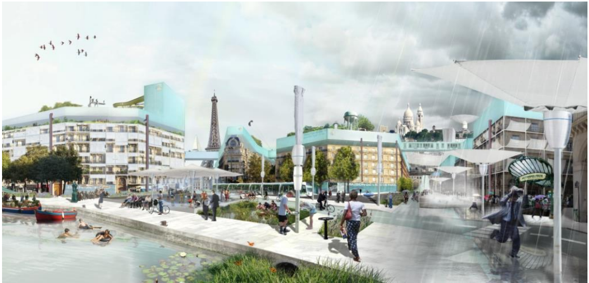
© Et alors - Architecture et Recherches urbaines, Yannick Gourvil et Cécile Leroux Réalisation en 2011 pour Eau de Paris | Tous droits réservés aux auteurs