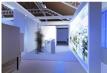
Vue 3D du module 3 de l'exposition © La Fabrique créative

Un plongeon dans le temps, c'est ce que vivront les visiteurs de l'exposition dans ce module consacré au Paris de 2 100, avec +2°. Dans un univers à la frontière de la fiction, illustré par l'imagination débordante des architectes du collectif « Et alors », la capitale luttant contre le réchauffement climatique se transforme, dévoile ses richesses et réinvente ses modes de vie. Les visiteurs découvriront la richesse de l'eau et de ses usages, de l'eau potable aux eaux usées, en passant par l'eau pétillante ou l'eau de pluie. Toutes ces eaux construiront la ville de demain et feront vivre les espaces urbains. Ce module met en lumière les moyens, actuels et à venir, pris par la Ville de Paris et Eau de Paris en matière d'innovation.