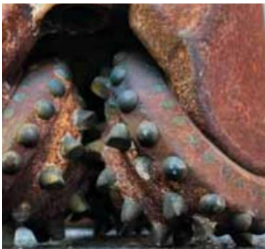
Forage dans la nappe de l'Albien – Paris 17 ème

C'est ce que permet de découvrir ce module dédié à la solution de géothermie expérimentée pour l'éco quartier Clichy-Batignolles (Paris 17 ème ) : Eau de Paris y a mis en place une installation pour produire 83 % des besoins en chaleur du quartier , en puisant de l'eau dans l'Albien, une nappe phréatique géothermique se situant à environ 600 mètres sous nos pieds.