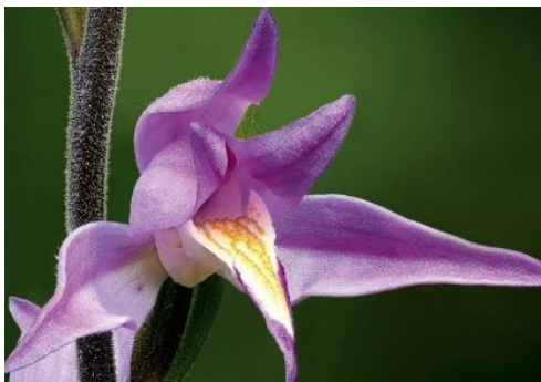
Céphalanthère rouge, espèce présente sur l'aqueduc de la Vanne

Mais qu'est-ce que la biodiversité ? À quoi sert-elle ? Pourquoi la protéger ? En quoi consiste la biodiversité en milieu urbain ? Ce module permettra au visiteur de comprendre les enjeux qui se jouent autour de la biodiversité et de découvrir ce que la Ville de Paris et sa régie mettent en œuvre en faveur de la protection de cette biodiversité urbaine.