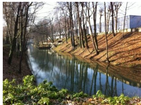
Berges du canal de fuite entre la Marne et l'Usine de Joinville